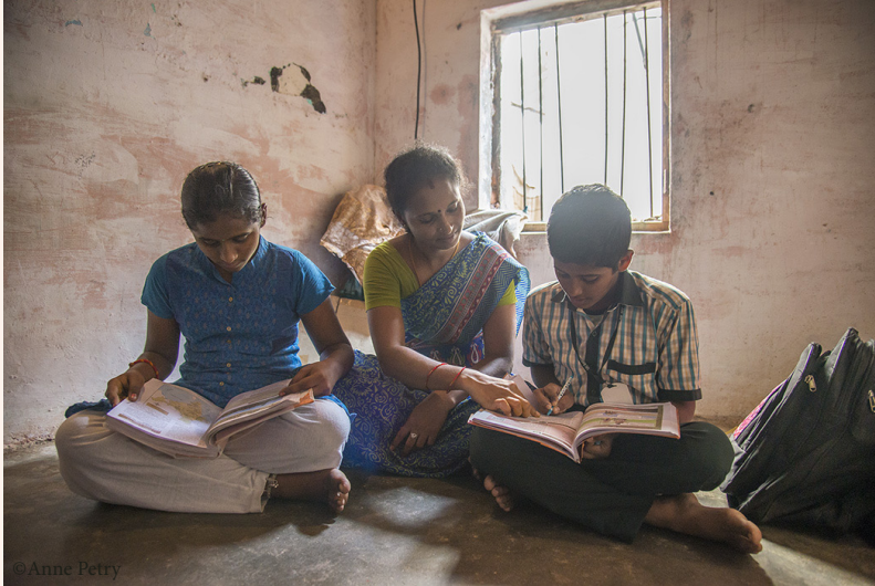
linke Seite: Unterwegs zur Schule oben: Lernen am Nachmittag