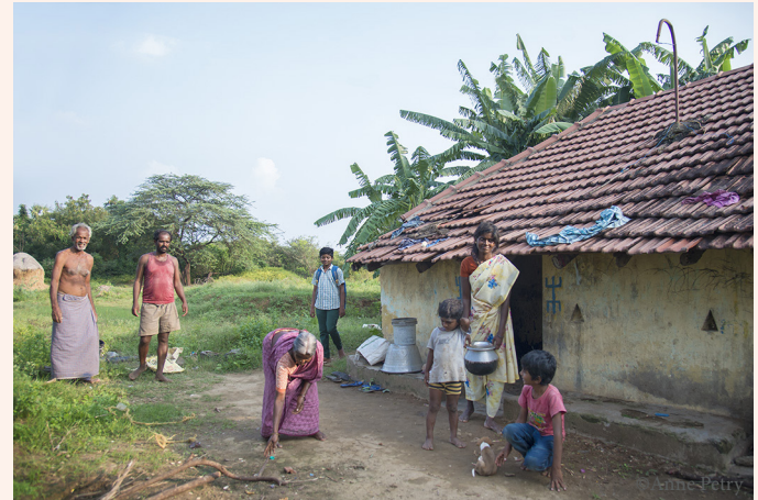
Seine gesamte Familie vor ihrem Haus