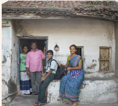
links: Mit seiner Mutter in der Küche rechts: Zusammen mit Eltern und Schwester vor seinem Elternhaus