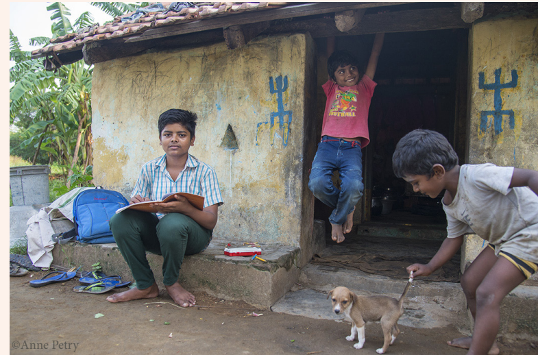
Hauseingang zu Wohn- und Schlafbereich, Vorratsraum und Küche